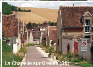
La Chapelle sur Oreuse (89)