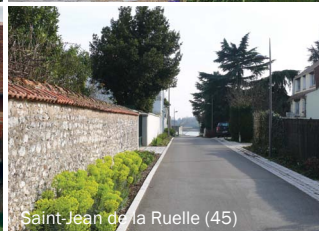
Saint-Jean de la Ruelle (45)